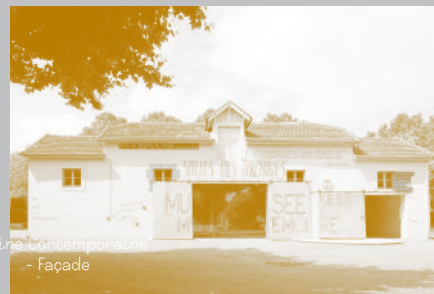
‘Vitrine Contemporaine’ - Façade

de Cransac ‘MUSÉE DE LA MÉMOIRE – PROPRIÉTÉ UNIVERSELLE ®’ » associe la réalisation d’une sculpture, le ‘Monument-Mémoire’ à deux ‘Vitrines’ : deux espaces qui exposent les archives réunies au moment de l’étude puis de la réalisation de l’œuvre.