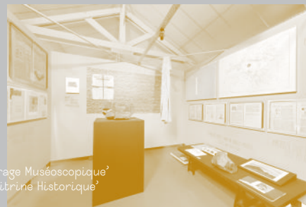
‘Coffrage Muséoscopique’ - ‘Vitrine Historique’