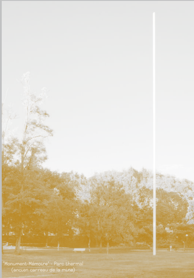
‘Monument-Mémoire’ - Parc thermal (ancien carreau de la mine)

‘MUSÉE DE LA MÉMOIRE – PROPRIÉTÉ UNIVERSELLE ®’