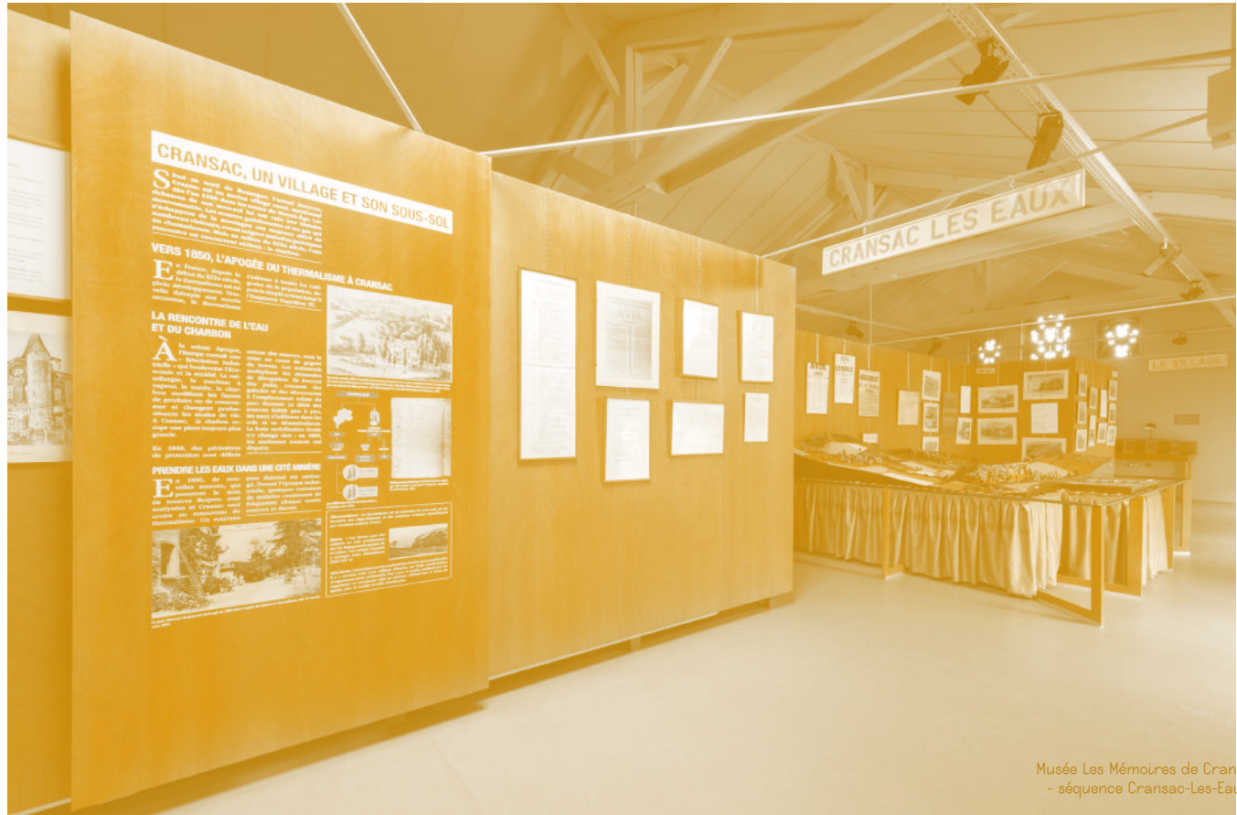
Musée Les Mémoires de Cransac - séquence Cransac-Les-Eaux