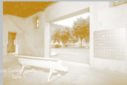
‘Vitrine Contemporaine’ - Salle II