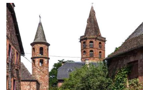
L'ÉGLISE SAINT MARTIAL

Bâtie à la fin du XIVe siècle à l'emplacement d'une église romane dont il ne reste que deux fenêtres, elle est dédiée à St Martial qui a engagé l'évangélisation dans la région vers l'an 60. Elle a été consacrée au XVIe siècle par François d'Estaing, Evêque de Rodez. La nef monumentale (35x11m) s'agrandit de huit chapelles, surmontées d'une tribune reposant sur trois arcades. Le pavé de l'édifice fut rehaussé d'environ 80cm, ce qui a descendu la hauteur des voûtes à 11m et caché la base des piliers.