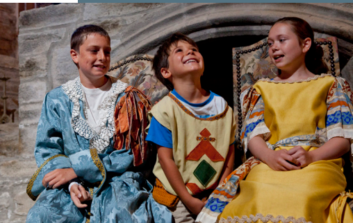
S'amuser au château