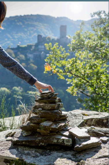
Les cairns de Valon