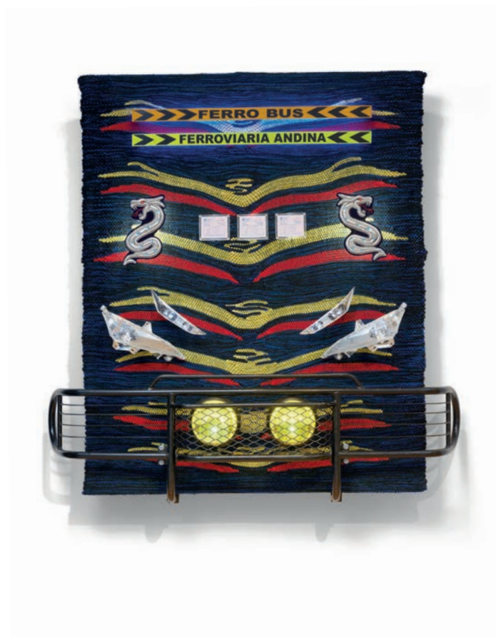
Couverture : Portrait Kenia Almaraz Murillo Page 2 : Ferro Bus , tissage