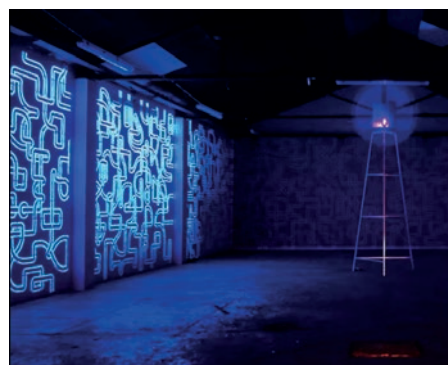
Peinture acrylique sur mur, sculpture lumineuse. L'amour, Bagnolet En collaboration avec le studio Elementaire 2016