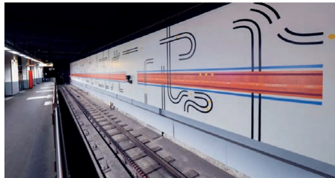
Fresque pérenne réalisée sur le quai de la station de métro Hôtel-de-Ville, Lyon. Commande de SYTRAL Mobilités. En collaboration avec Kenia Almaraz Murillo. 2024.

Il a réalisé plusieurs projets d'envergure pour des lieux culturels et urbains, notamment pour des cinémas UGC et le Grand Rex à Paris, collaborant régulièrement avec d'autres artistes et acteurs de la création contemporaine. Son travail invite le spectateur à percevoir la ville comme un organisme vivant, traversé de circulations permanentes.