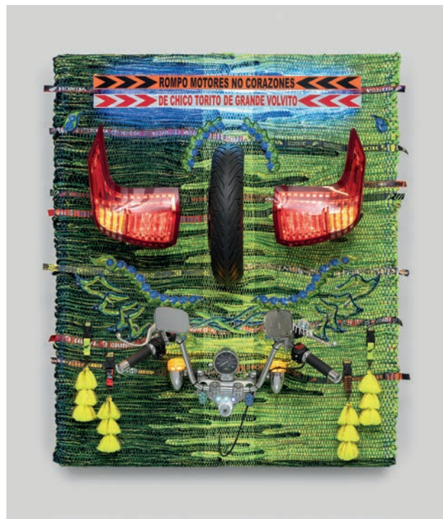
Torito, tissage, crédit photo Nicolas Brasseur

L'exposition de Kenia Almaraz Murillo investira tous les espaces du Château de Taurines pour développer un projet inédit. Son travail fera dialoguer les traditions andines et occitanes , mêlant la fibre et la lumière, le geste ancestral et la modernité technologique, pour donner naissance à une œuvre immersive, sensible et poétique.