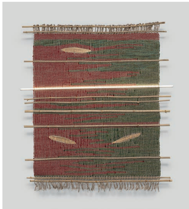
Pájaro Verde , tissage, crédit photo Nicolas Brasseur

Dans ses œuvres, Kenia intègre la lumière à ses tissages - tissés brodés ou suspendus - et y incorpore des objets de récupération (rétroviseurs, phares, néons LED). Ces associations créent un dialogue entre artisanat traditionnel et modernité urbaine.