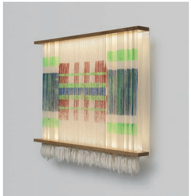
Tatú, sculpture

Ce programme est dédié à la mémoire de notre collègue et ami William Gourdin (1970 - 2024), chargé de diffusion d'expositions et d'actions en région Occitanie.