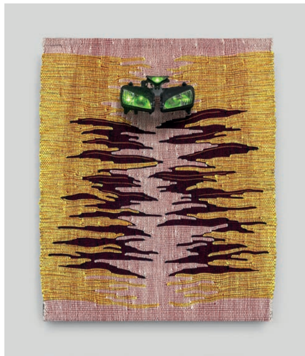
Señor Tigre , tissage

C'est dans ce contexte que le Château de Taurines , à Centres (Aveyron), accueille l'artiste pour une résidence et une exposition, du 20 juin au 18 octobre 2026 .